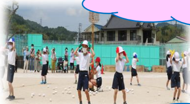
まさに「心を一つに」した6年生！