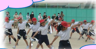
どの学年も、応援係のリードで盛り上がりました！