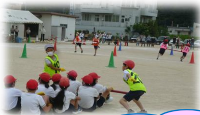
感染対策を講じての競技！